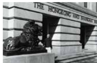
铜狮史提芬和施迪坐镇香港及上海的汇丰总行大厦接近一世纪