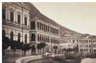
位于香港皇后大道中1号获多利行的第一代汇丰总行大厦